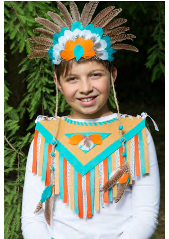
La coiffe et la parure d'indien