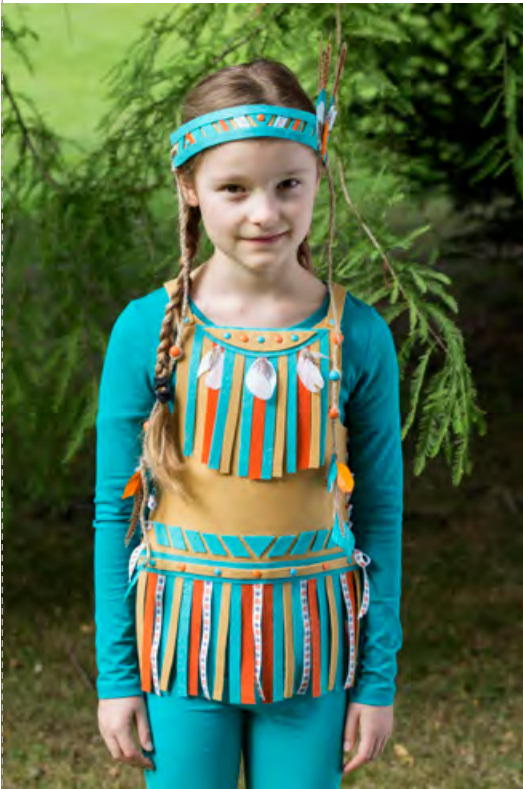
La tunique d'indienne